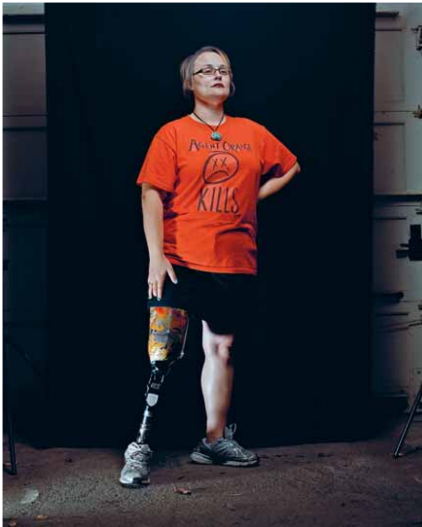
CANFIELD, OHIO, USA