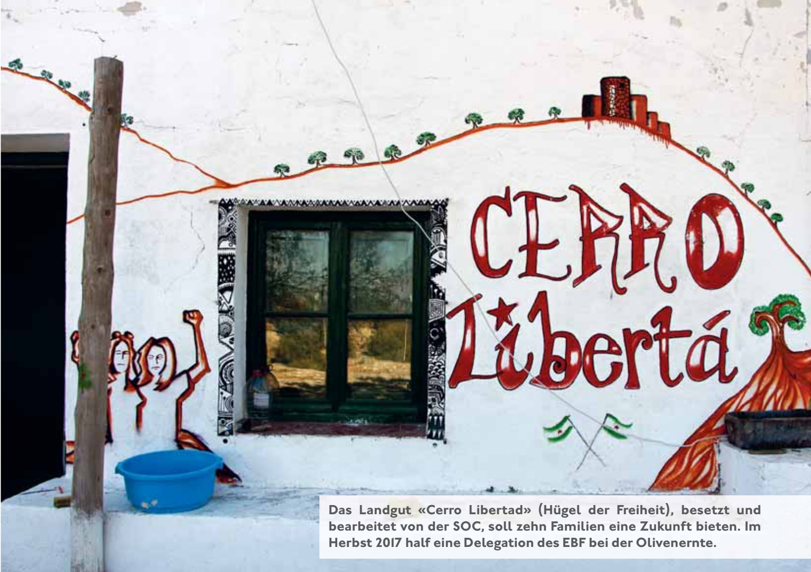
Das Landgut «Cerro Libertad» (Hügel der Freiheit), besetzt und bearbeitet von der SOC, soll zehn Familien eine Zukunft bieten. Im Herbst 2017 half eine Delegation des EBF bei der Olivenernte.