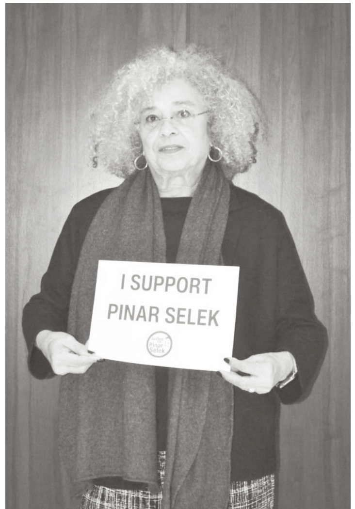
Angela Davis, 2024

PS: Wir suchen noch Leute, von politischen Gruppierungen, Parteien oder Organisationen bzw Initiativen sowie aus dem universitären und juristischen Milieu, die an der Delegation teilnehmen möchten! Wenn Ihnen das möglich ist, oder Ihnen jemand einfällt, den wir ansprechen könnten, schreiben Sie bitte an: justice@pinarselek.fr