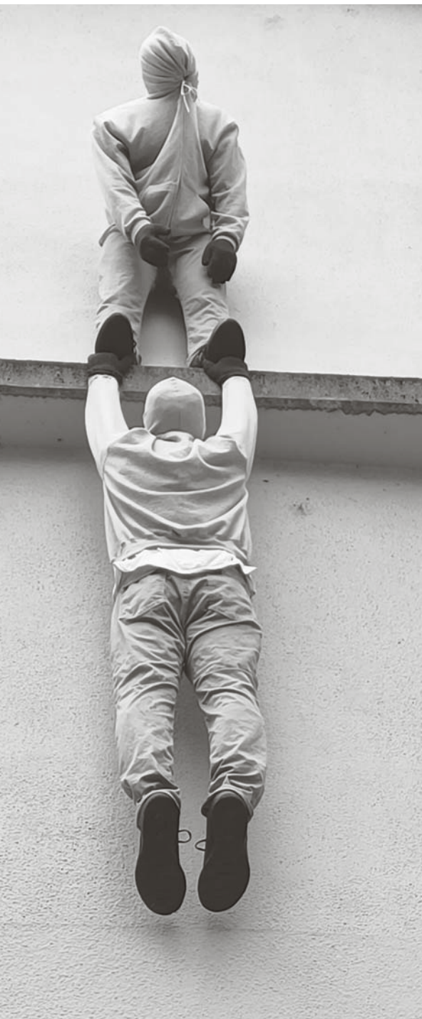
Die Hand reichen, jetzt! Wandskulptur, Basel 2024