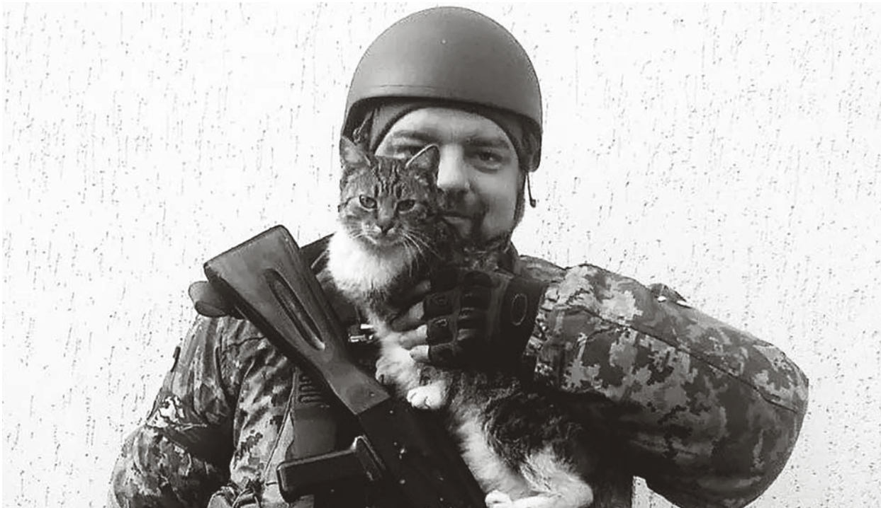
AZB 4001 Basel Europäisches BürgerInnen Forum, 4001 Basel

Zeitung des Europäischen Bürger:innen Forums