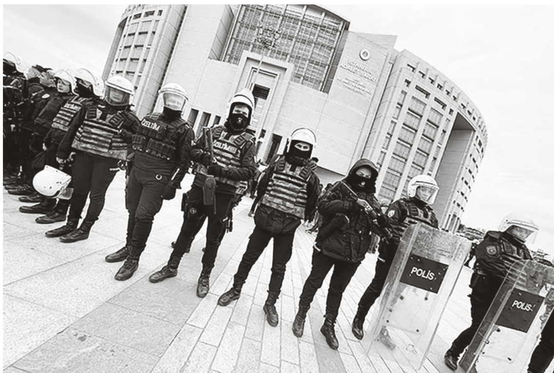
Drohkulisse vor dem Justizpalast in Istanbul.

1. Centre National des Recherches Scientifiques: Nationales Zentrum für wissenschaftliche Forschung in Frankreich 2. Institut de Recherche pour le Développement: Institut für Entwicklungsforschung