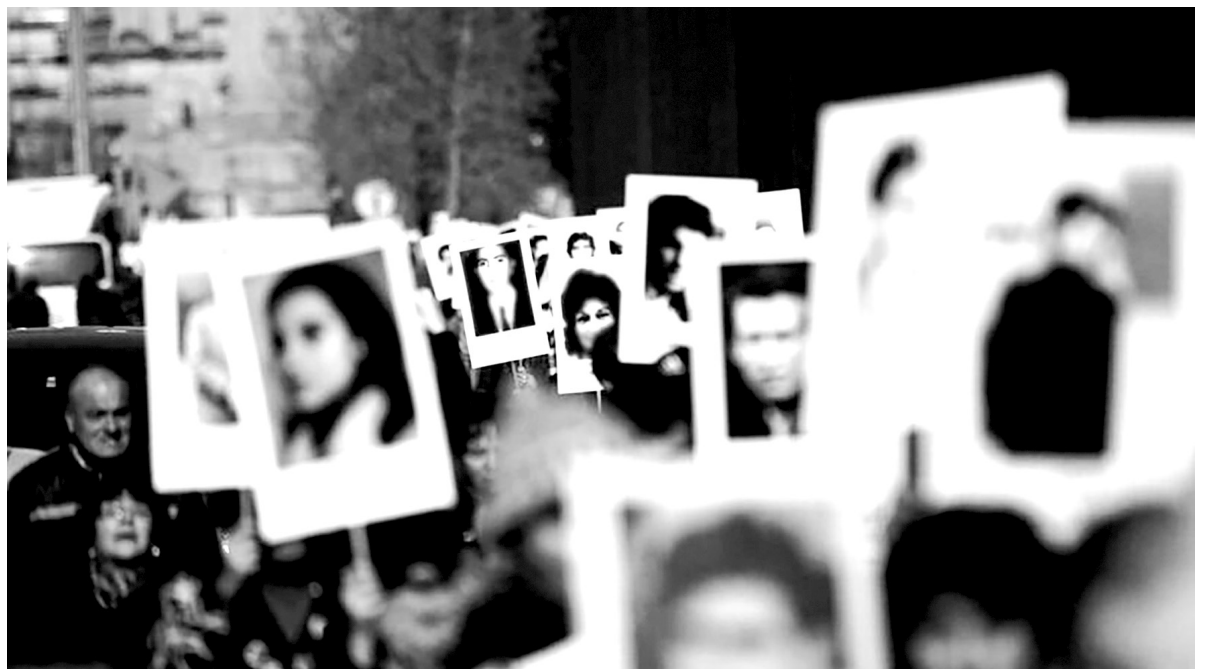
Aktivistinnen der «Madres Buscadoras» (Suchende Mütter).

Um sein Gewissen zu beruhigen, hat der Staat eine nationale Suchkommission eingerichtet und gibt vor, die Buscadoras zu schützen, indem er ihnen die Anwesenheit von Polizei- oder Militärkräften während