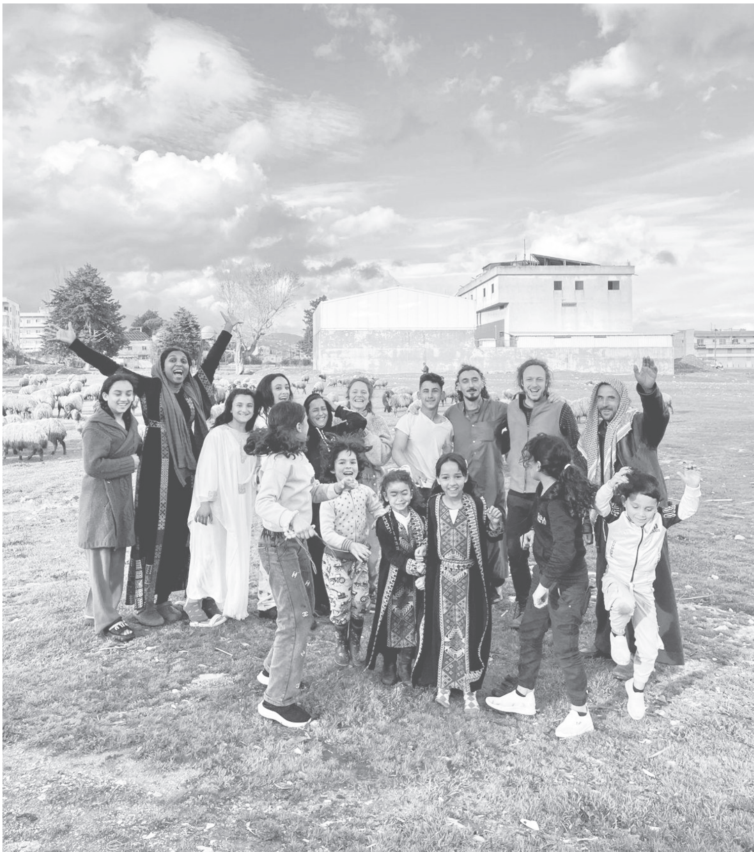
Das Team von Buzuruna Juzuruna (Die Samen sind unsere Wurzeln) in der Bekaa-Ebene im Libanon.

Nachdem so eine Situation bereits vor knapp anderthalb Jahren erlebt wurde, tauchten die Bürgerinitiativen bereits wieder in den ersten Stunden dieser neuen Eskalation des Krieges auf. Viele von ihnen hatten ihre Arbeit nie wirklich aufgehört, da viele Menschen nicht nach Hause zurückkehren konnten – aus einem einleuchtenden Grund: Ganze Dörfer waren von der Landkarte getilgt worden. Jetzt wurden zunächst Suppenküchen eröffnet, als Hunderttausende von Menschen auf der Strasse landeten. Bars und Restaurants