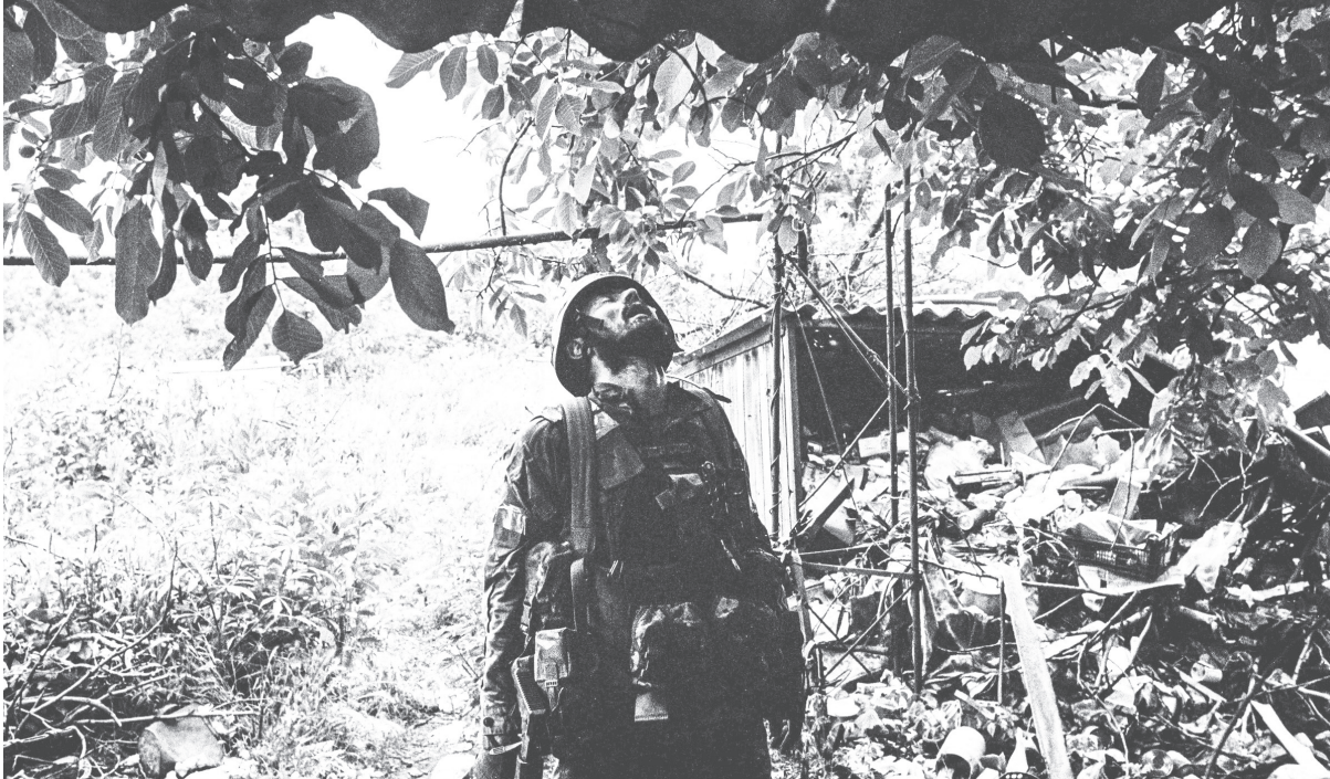
Ein erschöpfter ukrainischer Soldat.

Zeitung des Europäischen Bürger:innen Forums