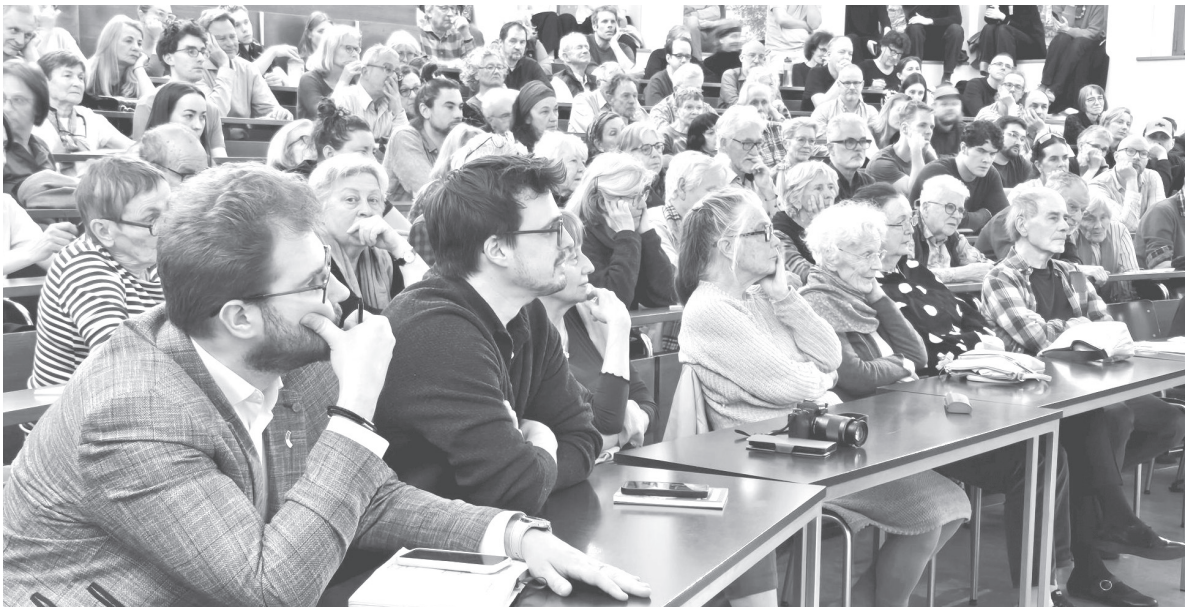
Wir danken noch einmal allen Menschen, die sich in den letzten Jahren für Maxim Butkewitsch eingesetzt haben und nun dazu beigetragen haben, den Hörsaal der Universität Basel zu füllen.

Bürger:innen Forum, Pro Longo maï, dem Ukrainischen Verein Schweiz/Basel, URIS (Ukrainian Research in Switzerland), der reformierten Kirche Basel-Land und die Evangelisch-reformierte Kirche Basel-Stadt. Der Hörsaal in der Universität war vollbesetzt und das Publikum äusserst konzentriert – ein gutes Zeichen dafür, dass das Interesse am Schicksal der Menschen in der Ukraine nicht nachlässt.