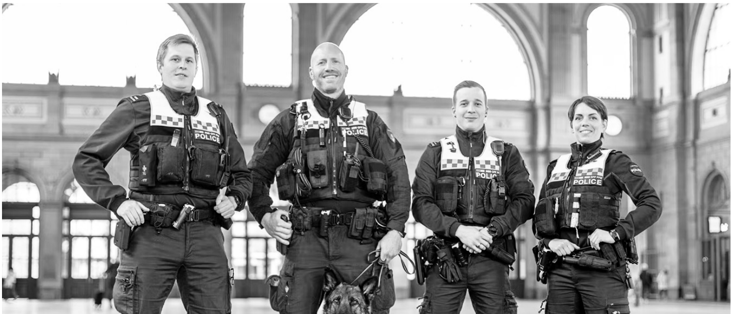
Ein Halbtax-SwissPass kann helfen, dass diese Polizisten und Polizistinnen auch Geflüchtete so freundlich anlächeln und nicht den Hund loslassen..

Spenden an: Soliticket, 3027 Bern, IBAN: CH69 0900 0000 1610 8622 2, Betreff: Soliticket Mehr Informationen: www.migrant-solidarity-network.ch