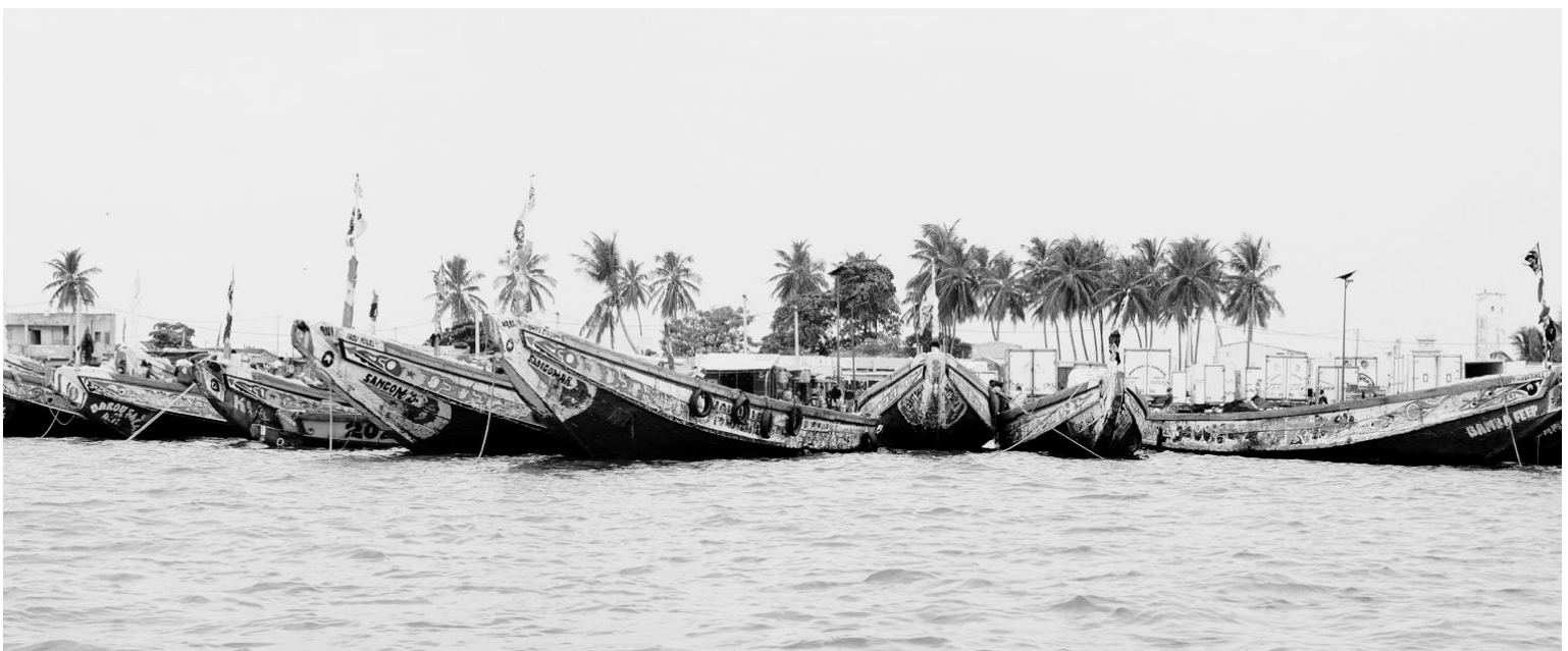
Mit diesen als Pirogen bekannten einfachen Fischerbooten wagen Menschen die gefährliche Überfahrt zu den Kanarischen Inseln.