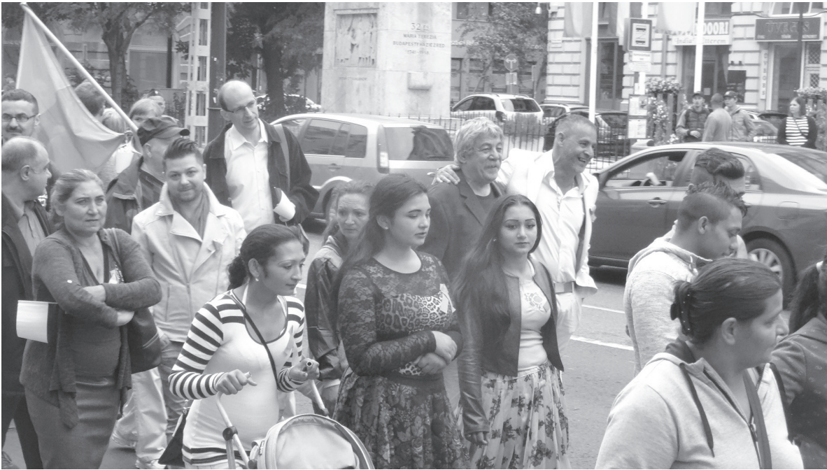
Manifestation des Roms pour l'égalité des droits en 2018 à Budapest - les élections d'avril ont ravivé l'espoir.

AZB 4001 Baile Forum Civique Européen, 4001 Baile Post CH AG