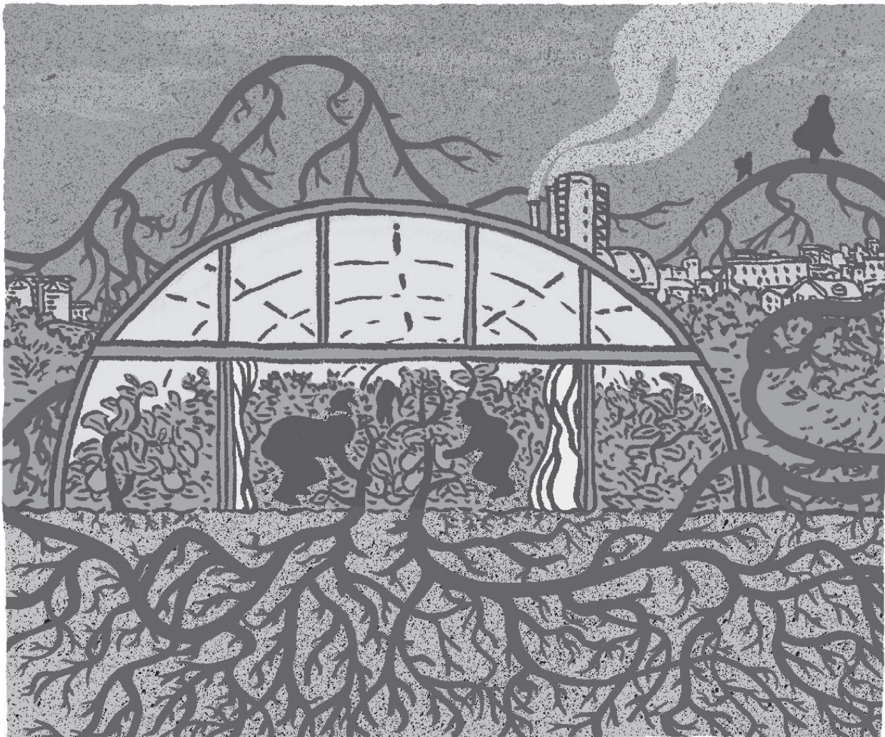
Illustration Pirikk pour CQFD

Pour plus d'information: Instagram: assoa4_ Voir aussi «France – Agriculture et migrations, l'Association A4» Archipel n° 338, juillet 2024.