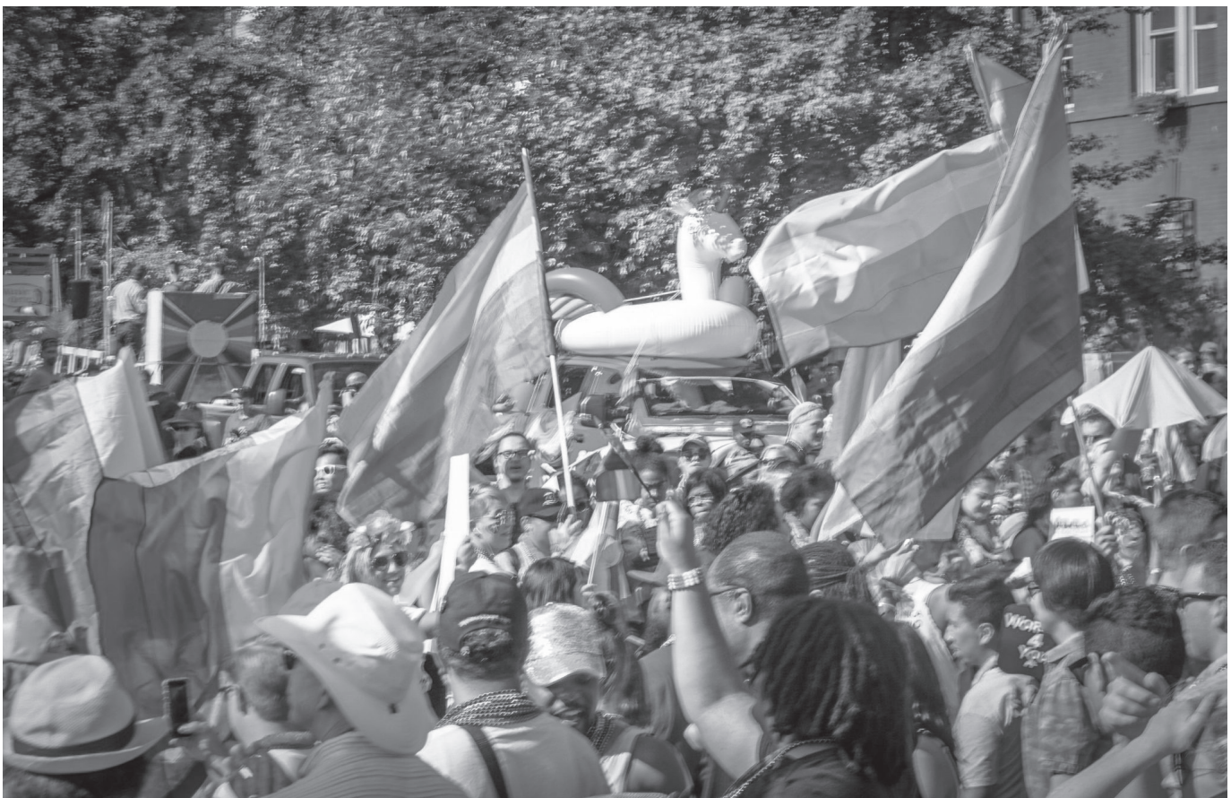
Photo de la Gaypride à Budapest, 2025

Il y a pourtant déjà des éléments qui méritent d'être suivis de près. Sur la question de l'immigration, la position de Magyar s'inscrit jusqu'à présent parfaitement dans le courant dominant européen prudent: mesurée, réfléchie et pas vraiment progressiste. Cette attitude ne déroge pas à la norme actuelle sur le continent; on peut donc difficilement la qualifier de trahison. Mais pour tou·tes celles et ceux qui espéraient que ce moment marquerait le début d'une ère plus ouverte et davantage axée sur les valeurs, cela peut sembler limiter d'emblée l'ampleur que prendra réellement ce nouveau départ.