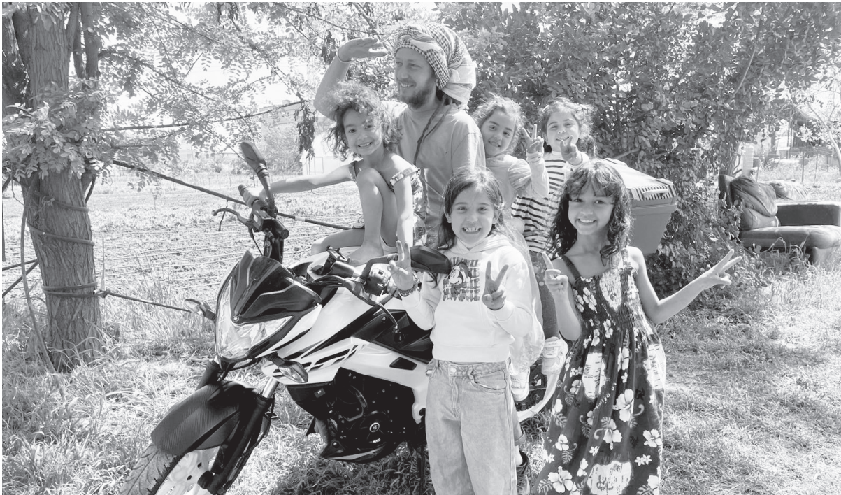
AZB 4001 Basel Europäisches Bürger:innen Forum, 4001 Basel Die Post CH AG

Zeitung des Europäischen Bürger:innen Forums