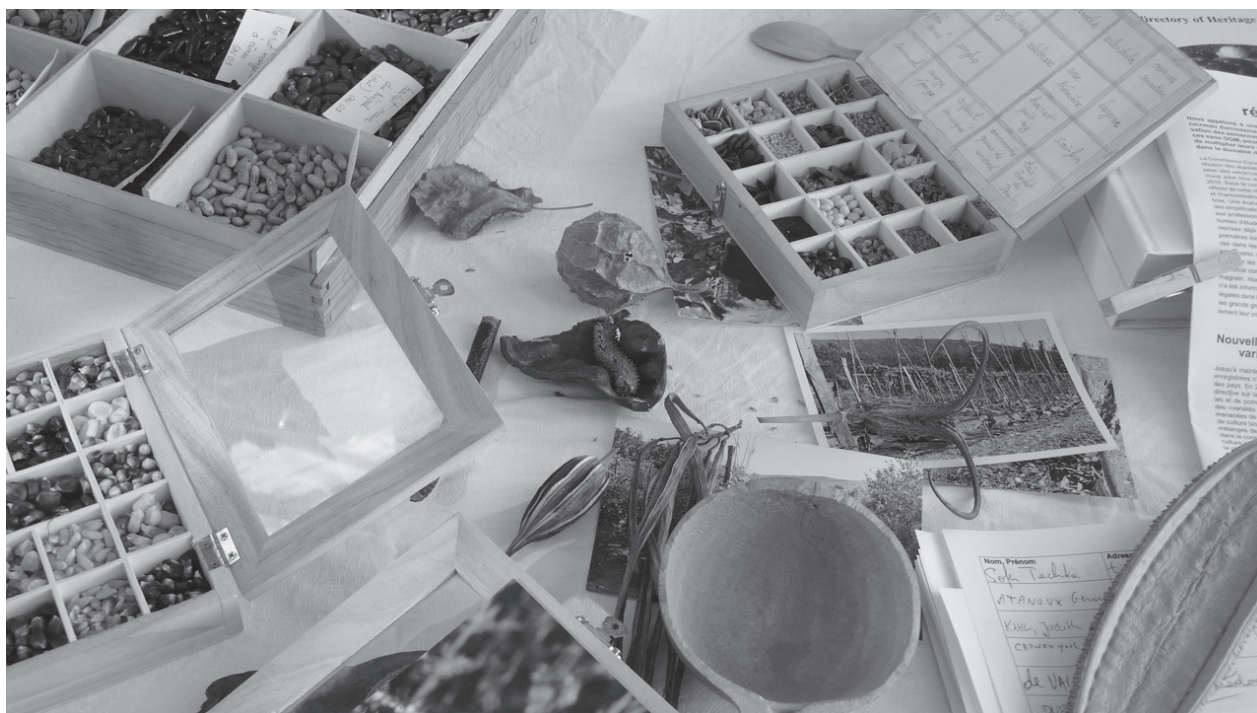
Une collection de semences, coopérative Longo mai, Limans

En tant que personnes concernées, nous constatons que notre travail essentiel de conservation des semences est, au mieux, toléré jusqu'à nouvel ordre. Nous sommes parvenu-es à la conclusion que nous avons besoin d'un droit fondamental qui reconnaisse notre travail et le protège, aujourd'hui et à l'avenir.