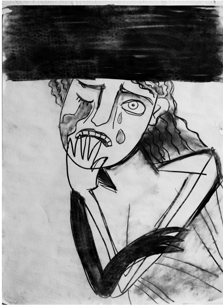
dessin Yulia Tsvetkova

Une grande partie de la population est activement impliquée dans la guerre. Nos invité·es ont une vision plutôt pessimiste de l'évolu-