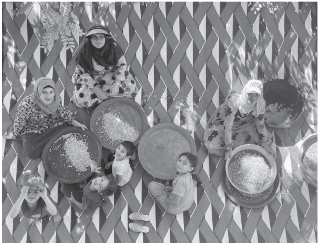
Tri des semences à la ferme Buzuruna Juzuruna, Liban

Lorsque nous parlons du droit de tou·tes aux semences, on nous demande souvent: «Comment vous l'imaginez-vous? Comment cela pourrait-il fonctionner?» C'est une bonne chose, car pour réaliser une utopie concrète, nous avons besoin de l'imagination nécessaire pour la visualiser. À quoi cela ressemblera-t-il donc lorsque le droit de tou·tes aux semences sera une réalité concrète? Comment cela peut-il fonctionner?