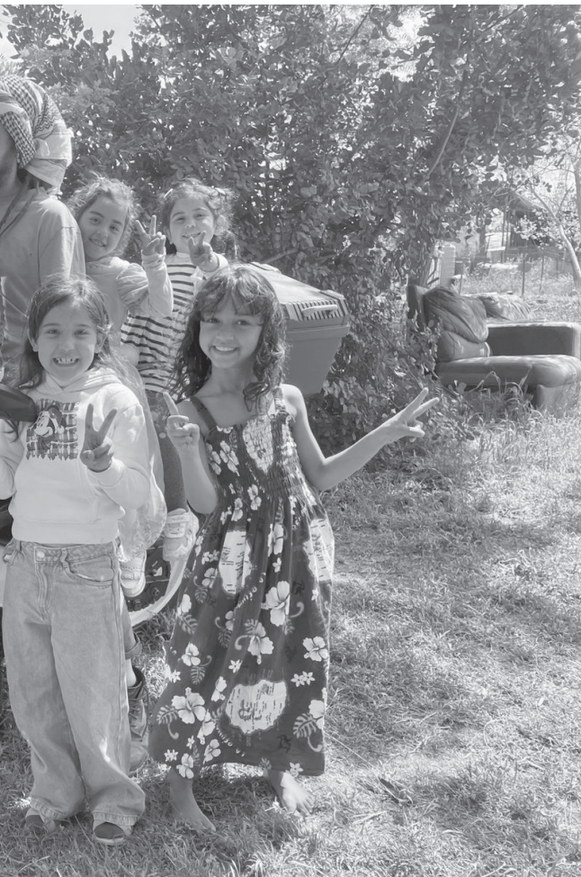
membre du projet agricole Buzuruna Juzuruna, et les enfants sur la ferme, 2026